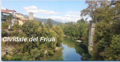
Cividale del Friuli