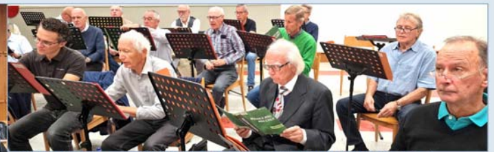
Unser Kern,,geschäft“, das Proben – ein Highlight für sich !