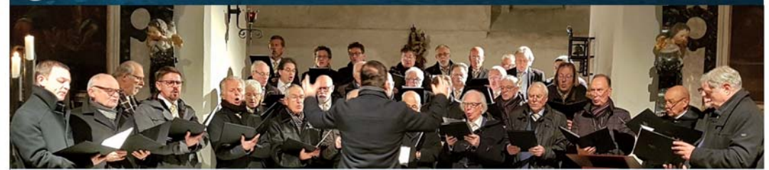
Adventskonzerte in Bregenz Oberstadt und Seekapelle, 11. bzw. 17. Dezember