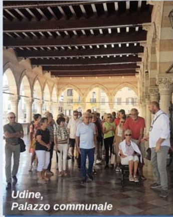
Udine, Palazzo comunale