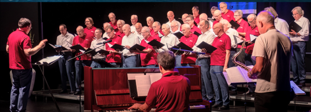
Konzert am 22. Oktober im Theater Kosmos