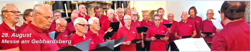
28. August Messe am Gebhardsberg