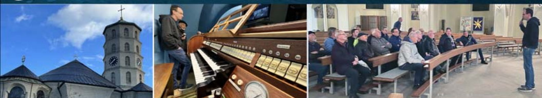
Musikalisches Kulinarium & Weinprobe mit der Männerrunde Mariahilf, 16. Nov.